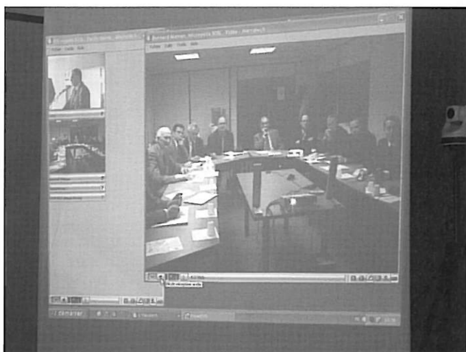
Visioconférence avec Paris.

renouvelables et l'aéronautique. Il faut donc vendre les Hautes-Alpes, les promouvoir auprès de chefs d'entreprises susceptibles de vouloir s'implanter ici. D'où l'idée de réseau. Chaque chef d'entreprise, scientifique, haut-alpin expatrié... en connaît d'autres. « Il faut aussi que les élus portent ce projet d'accueil de PME en créant des zones d'activités, le long des grands axes et en complémentarité des diverses entreprises déjà existantes. Car les PME n'ont pas toujours été une priorité départementale » disait le Préfet. Il faut également faire connaître les différentes exonérations possibles et notamment le système des Aides à Finalité Régionale, qui de Ribiers à Tallard, en passant par Laragne et Neffes, majorent les aides, immobilières, à l'investissement productif, à l'emploi etc... Le Préfet incitait à mettre en place « une force d'action rapide, afin d'être meilleurs qu'ailleurs dans l'aide apportée aux entreprises et résoudre l'ensemble des questions posées par un porteur de projet en un minimum de temps ! »